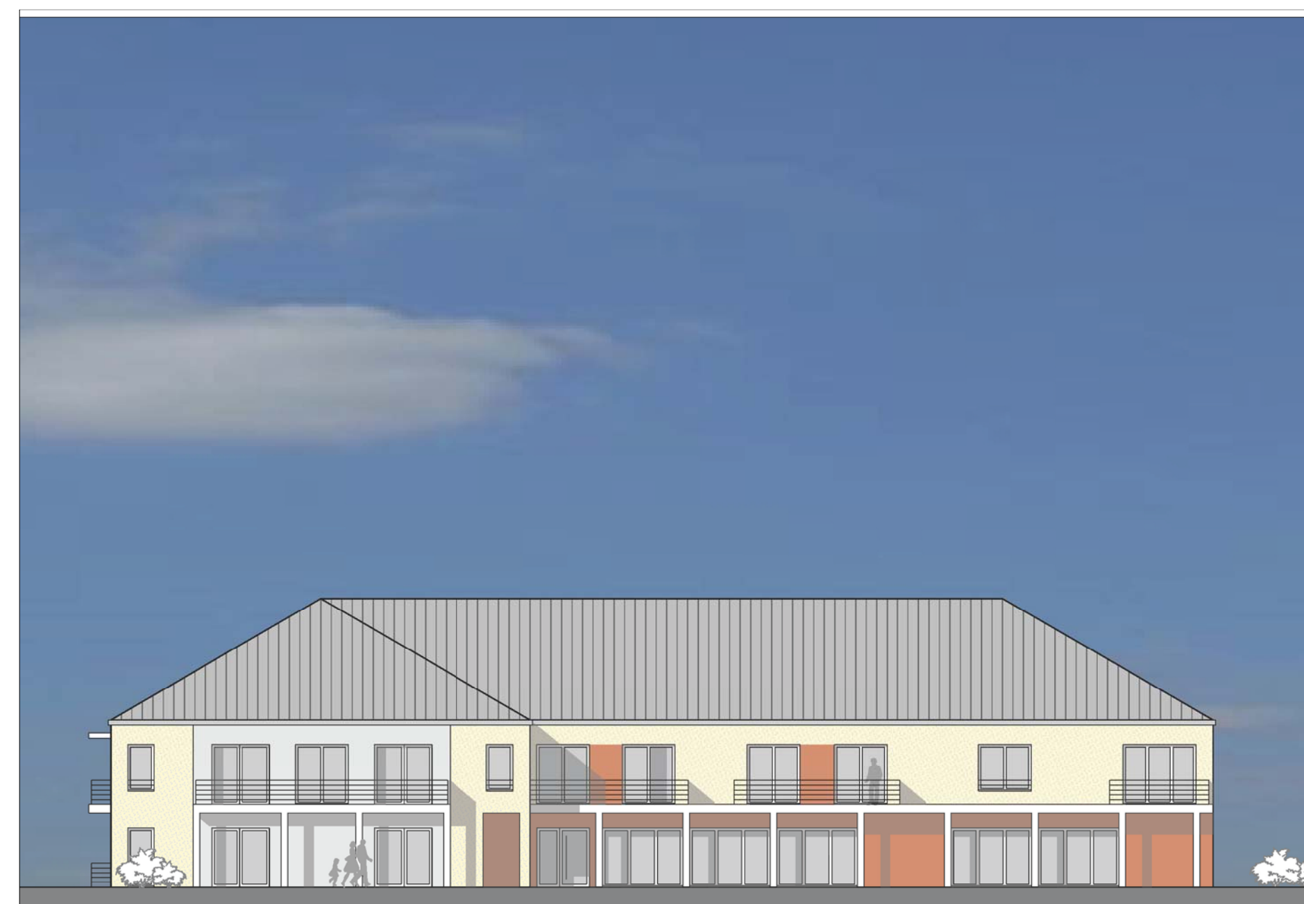
ANSICHT ZUM GYMNASIUM - EINGANGSSEITE