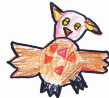
die Eulengruppe ...