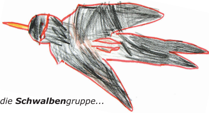
die Schwalbengruppe ...