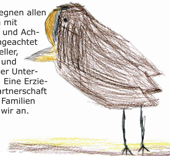
die Spatzen gruppe...

Wir begegnen allen Familien mit Respekt und Achtung, ungeachtet individueller, sozialer und kultureller Unterschiede. Eine Erziehungspartnerschaft mit den Familien streben wir an.